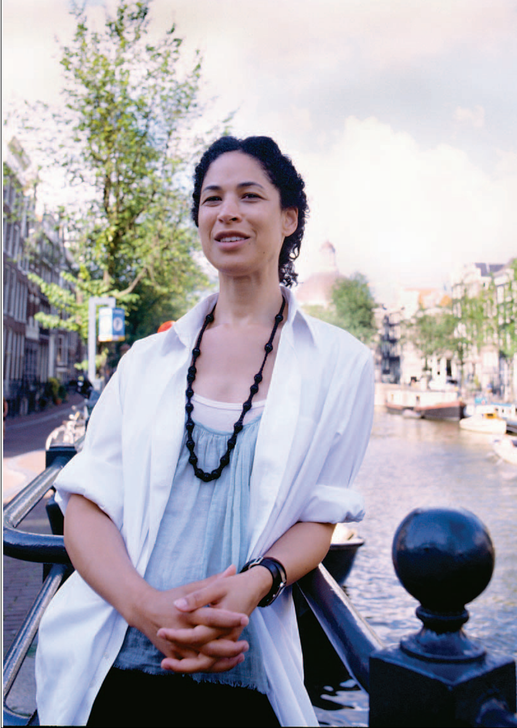
pagina 7, 19-08-2006